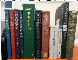
目録規則やくずし字辞典等